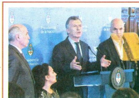
Ayer en un acto con el titular de la Corte, el jefe de Gobierno porteño y la vicepresidenta Gabriela Michetti

Expectativa por la reunión entre Trump y Jong-un